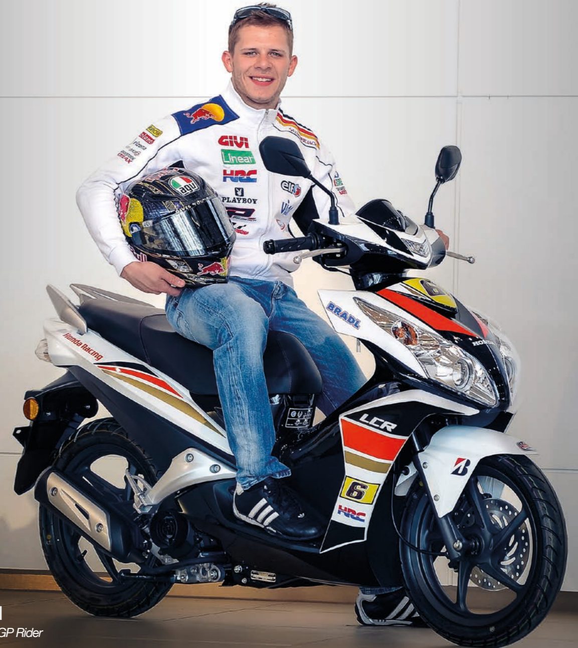
Stefan Bradl LCR Honda MotoGP Rider